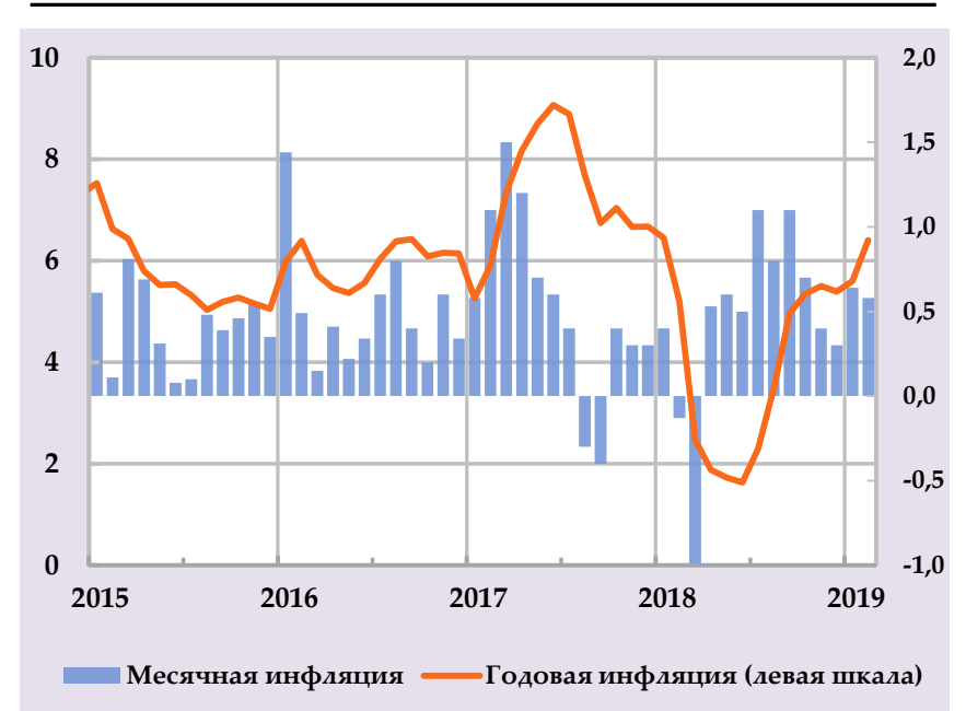
Влияние сезонных и внешних факторов на инфляцию, в %