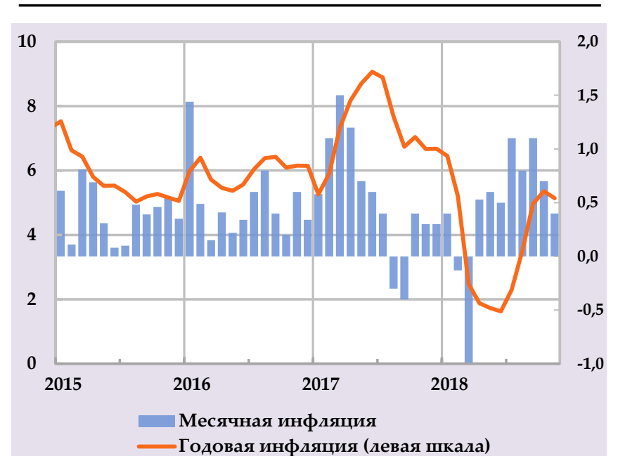
Рост группы потребительских цен и их структурный вклад, в % годовых