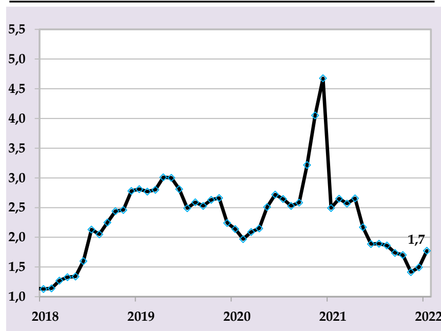
Базовая инфляция, в % годовых

Национальный банк Таджикистана продолжит реализацию денежно-кредитной политики по снижению влияния монетарных факторов на инфляцию с использованием монетарных инструментов для достижения прогнозируемого целевого показателя.