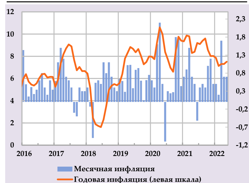
Рост группы потребительских цен и их вклад в структуру годовой инфляции, в %