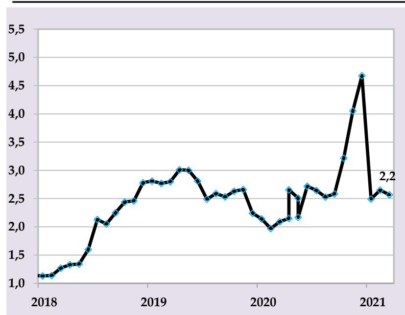
Базовая инфляция, в % годовых

В целях предотвращения дополнительных давлений на уровень инфляции Национальный банк Таджикистана продолжит реализацию сбалансированной денежно-кредитной политики посредством использования монетарных инструментов.