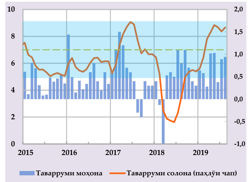
Афзоиши гурӯҳи нархҳои истеъмоли ва саҳми сохтории онҳо дар таваррум, бо % солона