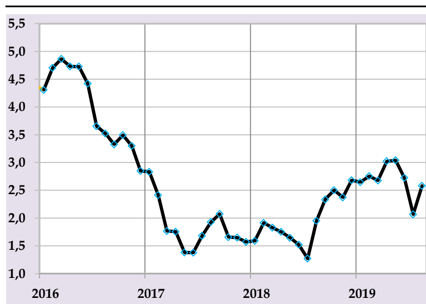
Таварруми асли, бо %, солона (манбаъ: Агентии омор, ҳисобҳои БМТ)

Бонки миллии Тоҷикистон бо мақсади бартароф намудани фишорҳои иловагӣ ба сатҳи таваррум ва то интиҳои сол ноил гардидан ба нишондиҳандаи мақсадноки пешбинишуда татбиқи сиёсати пулиро қарзии мутавозунро идома хоҳад дод.